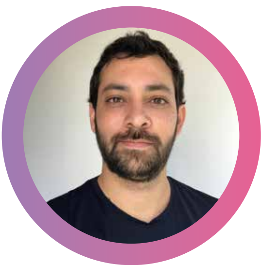
Leonardo Dantas Wildlife Studios